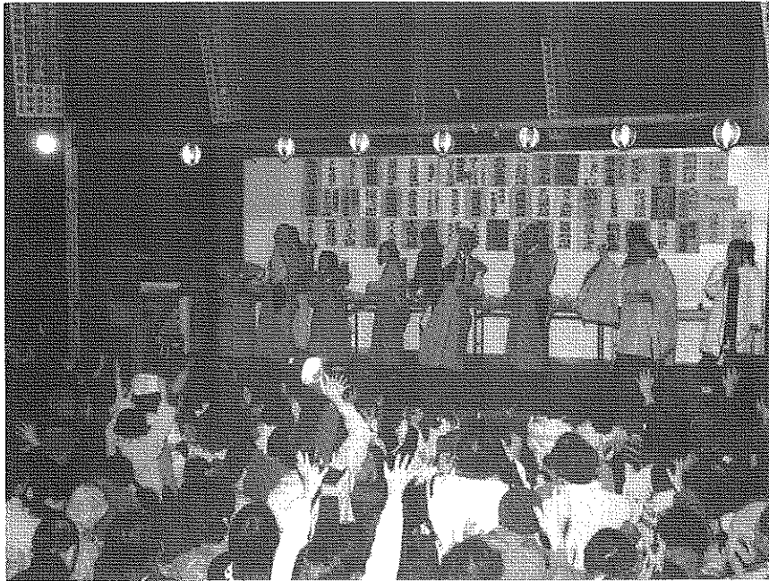
— 年男・年女の豆撒き — 平成21・2・3 阿蘇神社 http://asojinja.jp/