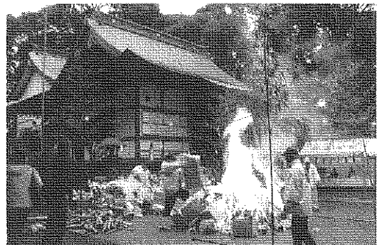
— 火 焼 神 事 —

また平成七年度より節分祭の運営の資金不足のため、各商社より協賛金をいただいております。協賛金は節分の諸経費と必需品の購入に使用しております。 本年の節分祭に協賛金を賜った商店・商社は以下の通りです。ご厚志に感謝し、御芳名を記して御礼を申し上げます。