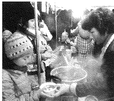
— 出店は盛況でした —