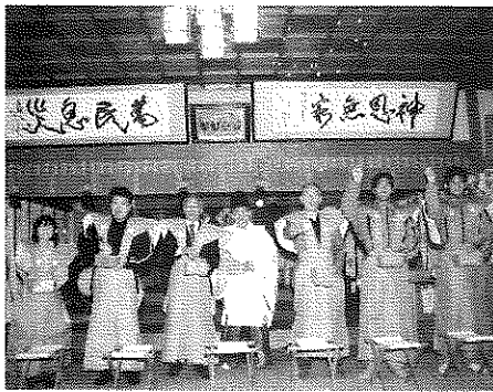
— 殿内での神事・まめ打ちの儀 —

節分行事の開催に当たり、準備から後片づけまで神社総代及び評議員、商工会青年部・女性部など多くの方々にご協力とご支援をいただきました。