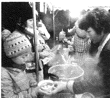
— 出店は盛況でした —