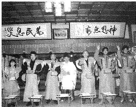
— 殿内での神事・まめ打ちの儀 —

節分行事の開催に当たり、準備から後片づけまで神社総代及び評議員、商工会青年部・女性部など多くの方々にご協力とご支援をいただきました。